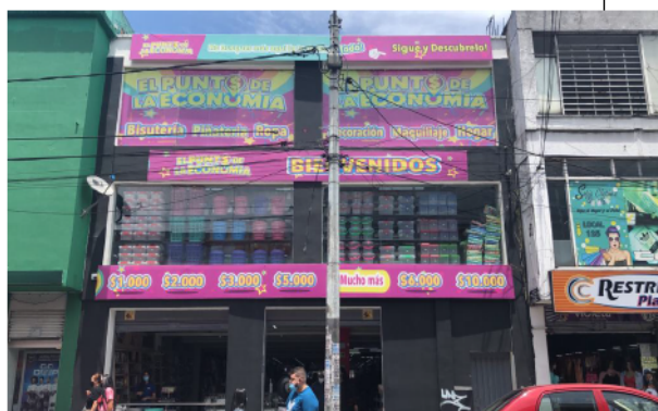
Fotografía a No. 2. Publicidad ubicada sobre la Cr 19 No. 17 -38 SUR.