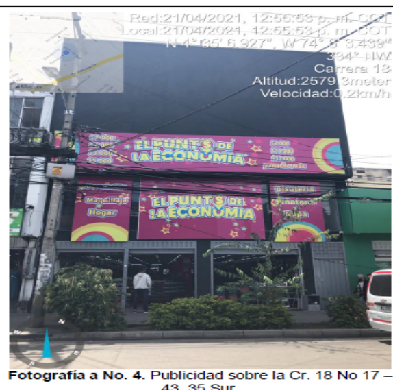
Fotografía a No. 4. Publicidad sobre la Cr. 18 No 17 - 43, 35 Sur.