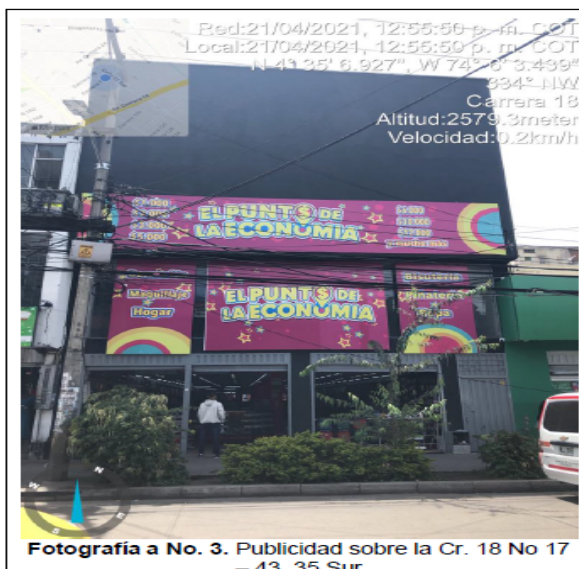
Fotografía a No. 3. Publicidad sobre la Cr. 18 No 17 - 43, 35 Sur