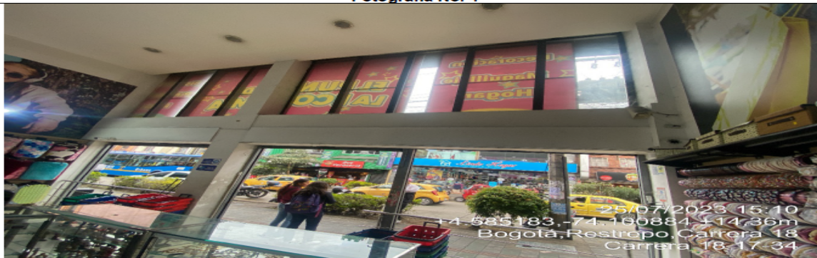
Fotografía No. 4

Fotografía interna de la fachada con vista hacia la CR 18 del establecimiento comercial denominado EL PUNTO DE LA ECONOMÍA RESTREPO, propiedad de la sociedad DISTRIBUIDORA D.Z.G S.A.S, en la que se puede evidenciar que la edificación es a doble altura.