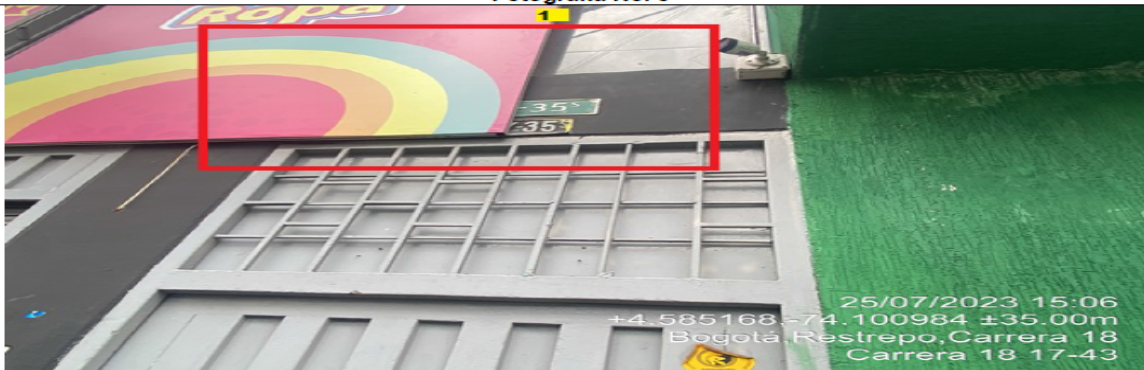
Fotografía No. 5

En la cual se evidencia la fachada con vista hacia la CR 18 del establecimiento comercial denominado EL PUNTO DE LA ECONOMÍA RESTREPO, propiedad de la sociedad DISTRIBUIDORA D.Z.G S.A.S, en la que se observa: un (1) elemento publicitario identificado con el número 1, el cual se encuentra obstruyendo la visibilidad de la nomenclatura urbana del predio donde funciona el establecimiento comercial.