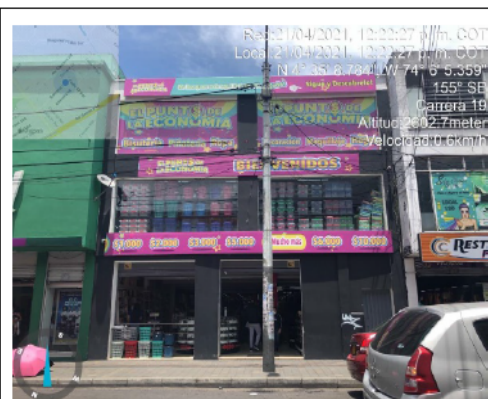
Fotografía No. 1. Publicidad ubicada sobre la Cr 19 No. 17 -38 SUR.