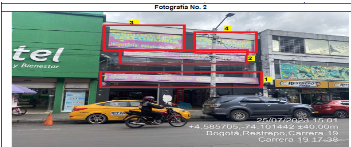
Fotografía No. 2

En la cual se evidencia la fachada con vista hacia la CR 19 del establecimiento comercial denominado EL PUNTO DE LA ECONOMÍA RESTREPO, propiedad de la sociedad DISTRIBUIDORA D.Z.G S.A.S, en la que se observa: un (1) elemento publicitario tipo aviso en fachada identificado con el número 1, el cual al momento de la visita se encontraba instalado sin el registro ante la SDA, así mismo, un (1) elemento publicitario tipo aviso en fachada identificado con el número 2, el cual se encuentra superando el antepecho de segundo piso y es adicional al único elemento permitido por fachada de establecimiento comercial, y dos (2) elementos publicitarios identificados con los números 3 y 4, los cuales se encuentran ubicados en las ventanas de la edificación.