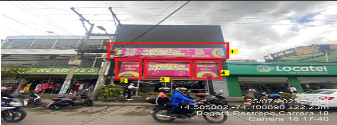
Fotografía No. 3

En la cual se evidencia la fachada con vista hacia la CR 18 del establecimiento comercial denominado EL PUNTO DE LA ECONOMÍA RESTREPO, propiedad de la sociedad DISTRIBUIDORA D.Z.G S.A.S, en la que se observa: un (1) elemento publicitario tipo aviso en fachada identificado con el número 1, el cual al momento de la visita se encontraba instalado sin el registro ante la SDA, así mismo, tres (3) elementos publicitarios identificados con los números 2,3 y 4, los cuales se encuentran ubicados en las ventanas de la edificación.